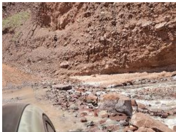
Расми 7. Гузаришгоҳҳои мавҷудаи чӯйборҳо дар сатҳи замин

Пешбинӣ карда мешавад, ки роҳи нави се чӯйборро тавассути пулҳои убури мекунад, дутои дигарро тавассути гузаргоҳҳои ҳамвор (ки «новаҳои кушод» номида мешаванд) ва боқимондаро тавассути қубурҳои каналҳои чоркунҷа, ки ба об имкон медиҳанд аз зери сатҳи роҳ гузаранд 4 . Дар Расми 8 намунаи гузаргоҳи ҳамвор дар ҳоли сохтмон бо сохтори ноаи кушод (дар роҳи дигар) нишон дода шудааст, ва дар Расми 9 каналҳои чоркунҷа ва қубурӣ нишон дода шудаанд.