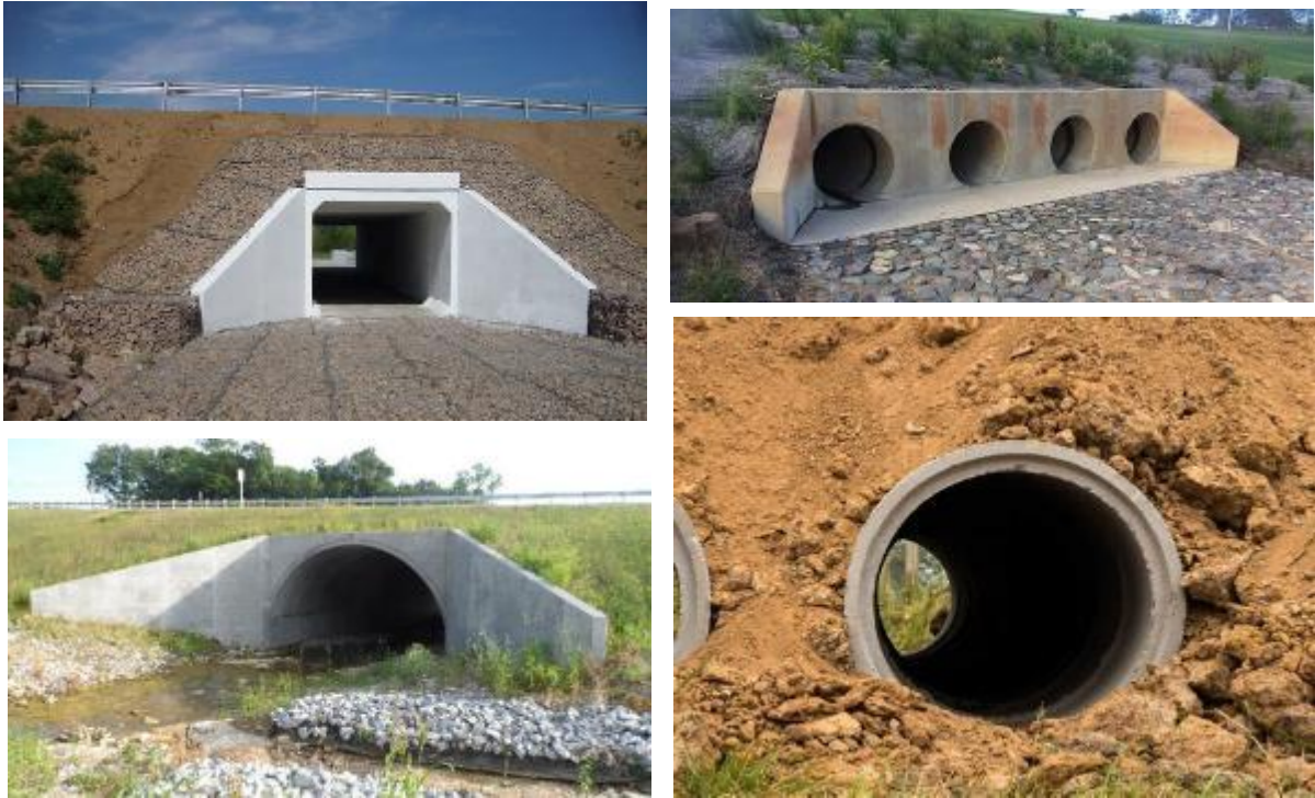
Расми 9. Сохторҳои маъмулӣ барои қубурҳо ва каналҳои чоркунҷа

Соҳторҳои обгузарон барои убури додани ҷараёнҳо бо давраи такроршавӣ тақрибан 50 сол пешбинӣ шудаанд, дар ҳоле ки пулҳо барои давраи такроршавӣ 100 сол 5 пешбинӣ шудаанд. Хусусиятҳои убури обгузаронҳо дар Ҷадвали 10 оварда шудаанд.