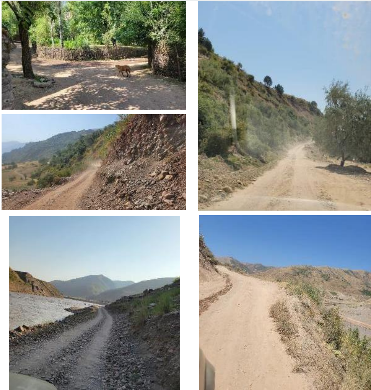
Расми 2. Қисматҳои намунавии роҳи мавҷуда дар ҳавои хушк (июни 2025)

Роҳи нави сохтмонӣ, ки барои иваз намудани роҳҳои мавҷуда пешбинӣ шудааст, тақрибан аз 11 км дуртар аз сарбанд оғоз ёфта, дар масофаи 40,5 км байни Сайидон ва Лабичар тӯл мекашад, ҳамзамон 12,5 км роҳҳои дастрасӣ барои пайвасти кардани деҳаҳои берун аз хатсайрҳои асосӣ сохта мешаванд. Тақрибан нисфи роҳи асосӣ (20 км) ва ҳамаи роҳҳои дастрасӣ дар хатсайрҳо ва маҳалли ҷудокунии мавҷудаи роҳҳои ҳозира гузаронида мешаванд. Боқимондаи 20 км роҳи асосӣ дар қитъаи нав сохта мешавад, ҳарчанд аксар вақт он наздик ба роҳи мавҷуда хоҳад буд. Дар ҷойҳое, ки роҳҳои мавҷуда аз миёни деҳаҳо мегузаранд, роҳи нави ба ҳамон хатсайр пайравӣ намуда, аз ҳамон маҳалли ҷудокунии мавҷуда истифода мекунад, бе он ки бо боғҳо ё манзилҳои истиқоматӣ, ба истиснои 27 ҳоҷагии зарардида, ки дар боло тавсиф шудаанд, даҳлат кунад. Хатсайрҳои роҳҳои кӯҳна ва нави зер оварда шудаанд. 3