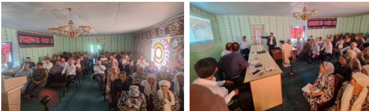
Расми 16. Вохӯрӣ бо ҷонибҳои манфиатдор 18 июли 2025 сол

Рӯзи 18 июли 2025, ММЗ дар деҳаи Яхчи Ҷамоати И. Халимоваи ноҳияи Нурабод вохӯрӣ барои сокинони соҳили чап баргузор намуд, то лоиҳаи роҳи соҳили чап, аз ҷумла аз байн рафтани пулҳо бо пур шудани обанбор ва сохтмони қисмати нави роҳро муҳокима кунад. Дар ин вохӯрӣ зиёда аз 130 сокини деҳаҳои соҳили чап (аз ҷумла баъзе аз деҳаҳои, ки оянда кӯчонида мешаванд) ширкат карданд (нигаред Расми 16).