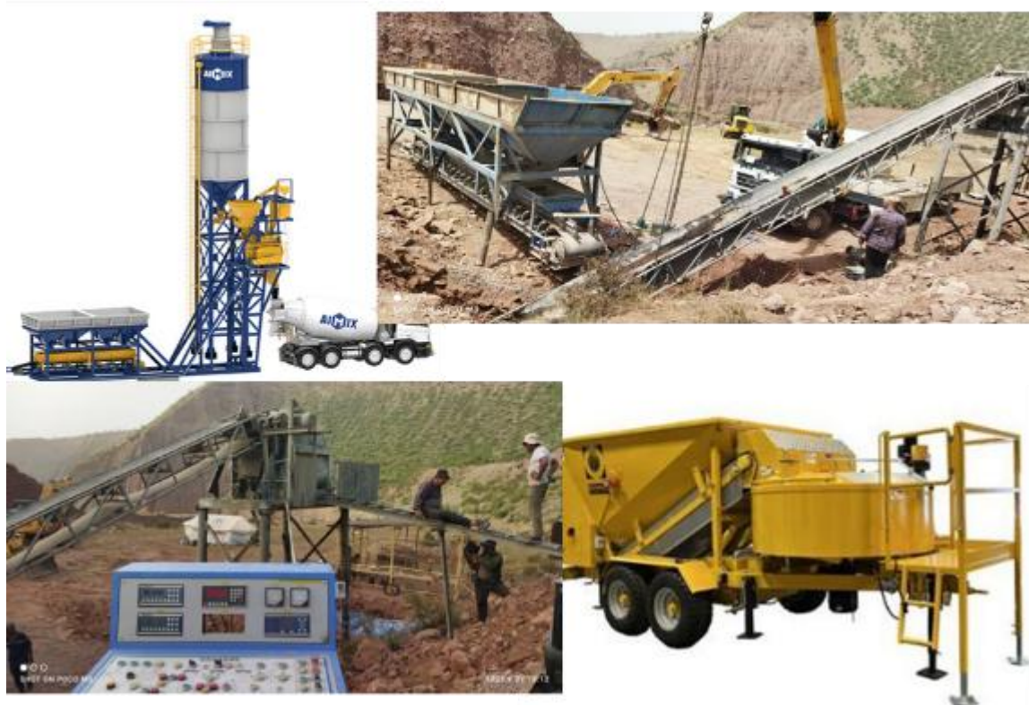
Расми 12. Заводҳои хурди бетони маълумӣ

Пудратчӣ барои сохтани зерқабати роҳ ва рӯйпӯши он миқдори назарраси рег, шағал ва санг талаб мекунад, инчунин сангҳои калонтар барои пур кардани габионҳо, ки дар ҷойҳои гузашта