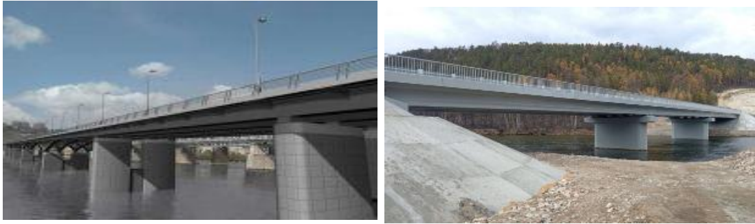
Расми 6. Пулҳои монанд ба пулҳои нав

Дар соҳили чапи дарё ва обанбори оянда танҳо 15 деҳа вуҷуд дорад ва роҳ мустақиман аз нӯҳтои онҳо мегузарад. Феҳристи деҳаҳо дар Ҷадвали 9 оварда шудааст.