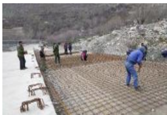
Расми 8. Гузаргоҳи намунавии нави лотокҳои кушода дар сатҳи замин дар ҷараёни сохтмон

Пешбинӣ карда мешавад, ки роҳи нави се чӯйборро тавассути пулҳои убури мекунад, дутои дигарро тавассути гузаргоҳҳои ҳамвор (ки «новаҳои кушод» номида мешаванд) ва боқимондаро тавассути қубурҳои каналҳои чоркунҷа, ки ба об имкон медиҳанд аз зери сатҳи роҳ гузаранд 4 . Дар Расми 8 намунаи гузаргоҳи ҳамвор дар ҳоли сохтмон бо сохтори ноаи кушод (дар роҳи дигар) нишон дода шудааст, ва дар Расми 9 каналҳои чоркунҷа ва қубурӣ нишон дода шудаанд.