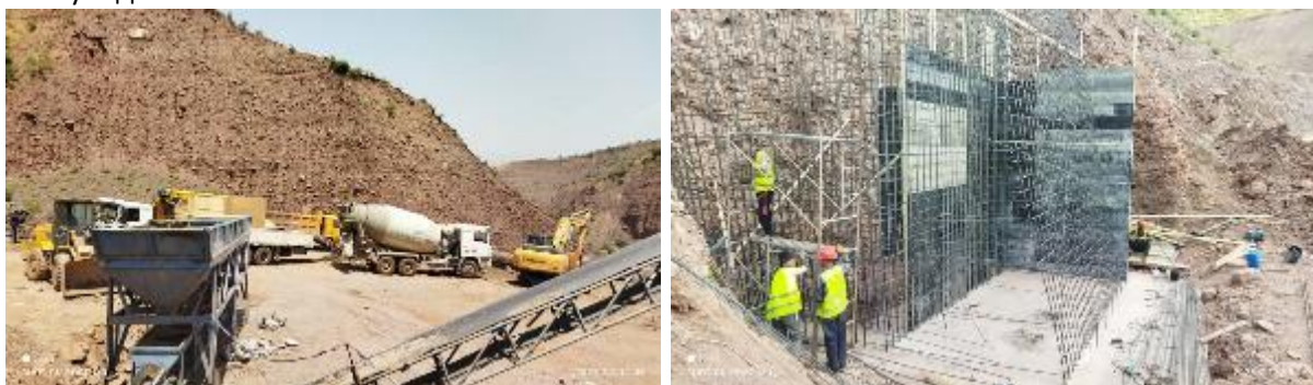
Расми 11. Сохтмони ҷорӣ, ки барои сохтмони оянда намунавӣ ҳисобида мешавад (тақияҳои пул дар тарафи рост)

Ҳар як майдони сохтмонӣ (дар давраи авҷи корҳо онҳо метавонанд панҷ ва ё бештар бошанд) эҳтимол то 15–20 коргар ва ҳадди ақал як–ду мошини боркаш ва борбардор барои интиқоли масолеҳро дар бар хоҳад гирифт. Сохтмони се пул ва баъзе гузаргоҳҳои оби қубурӣ/чоркунҷа нисбат ба ҳуди роҳ то андозае мураккабтар ва меҳнатталабтар хоҳад буд, бинобар ин барои ин корҳо шумораи бештари коргарон ва техника талаб карда мешавад. Дар Расми 11 сохтмони пули 6 муваққатӣ дар миёнаи соли 2025 дар наздикии Бедихо ва Сайидони Нав нишон дода шудааст — он қисми лоиҳа нест, аммо намунаи маъмулии майдони сохтмониро инъикос мекунад.