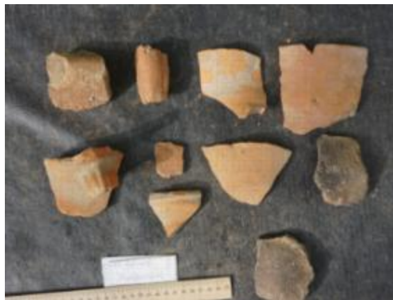
Расми 13. Пораҳои сафолӣ аз Қалъаи Нок

Роҳ аз деҳаи Кумбак дар сатҳи болотар мегузарад, бинобар ин қалъа берун аз минтақаи соҳтмони роҳ қарор дорад. Тибқи сафолҳои пайдошуда дар он ҷо, он ба асрҳои XVIII–XIX мансуб аст. Шимолу шарқтар аз деҳаи Саричӯй низ харобаҳои як қалъаи хурд, ки аз ҷониби сокинони маҳаллӣ ҳамчун Қалъаи Нок маъруф аст, ошкор шуданд, ки он низ ба асрҳои XVIII–XIX мансуб аст, тибқи пораҳои сафолӣ (нигаред Расми 13).