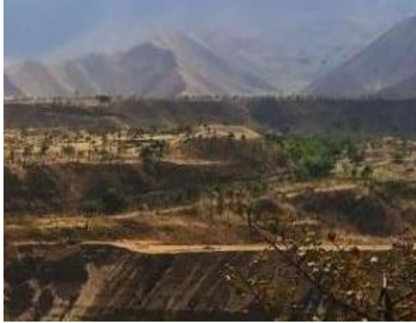
Расми 14. Қалъаи Сангдевора (баландии мураббаъ дар марказ)

Роҳ аз деҳаи Кумбак дар сатҳи болотар мегузарад, бинобар ин қалъа берун аз минтақаи соҳтмони роҳ қарор дорад. Тибқи сафолҳои пайдошуда дар он ҷо, он ба асрҳои XVIII–XIX мансуб аст. Шимолу шарқтар аз деҳаи Саричӯй низ харобаҳои як қалъаи хурд, ки аз ҷониби сокинони маҳаллӣ ҳамчун Қалъаи Нок маъруф аст, ошкор шуданд, ки он низ ба асрҳои XVIII–XIX мансуб аст, тибқи пораҳои сафолӣ (нигаред Расми 13).