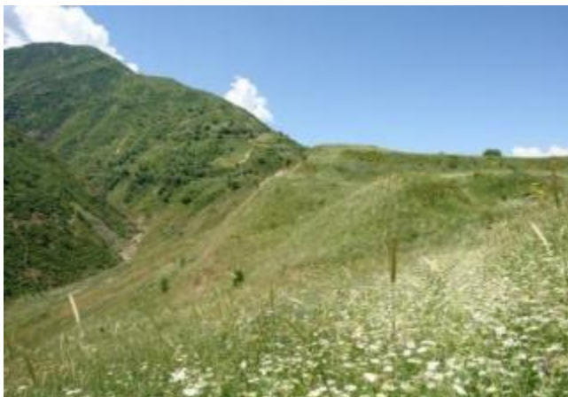
Расми 15. Ҳудуди Қалъаи Чамхур

Пажӯҳишгоҳ ба хулоса омад, ки дар минтақаи таҳқиқшуда ягон ёдгории таърихӣ ё бостоншиносии муҳим вучуд надорад. Инро ду омил асосӣ шарҳ медиҳанд: